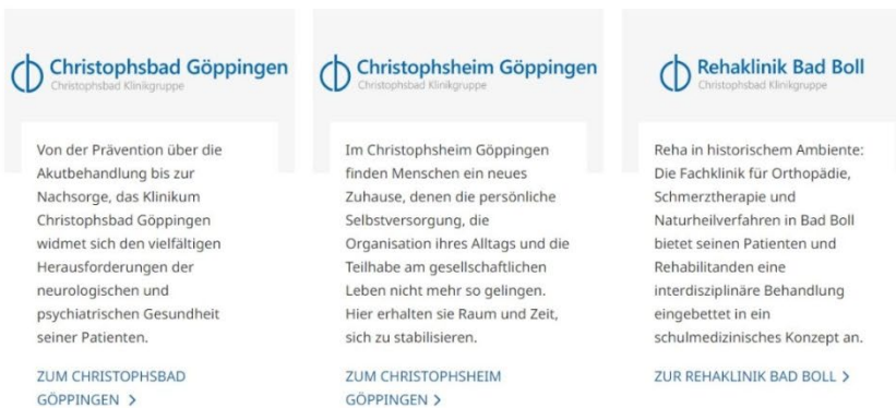
Abbildung 1: Christophsbad Klinikgruppe www.christophsbad-klinikgruppe.de

In unseren 5 Einrichtungen an 6 Standorten zwischen Stuttgart und der Schwäbischen Alb stehen für Patienten, Rehabilitanden und Bewohner rund 1.100 Betten zur Verfügung.