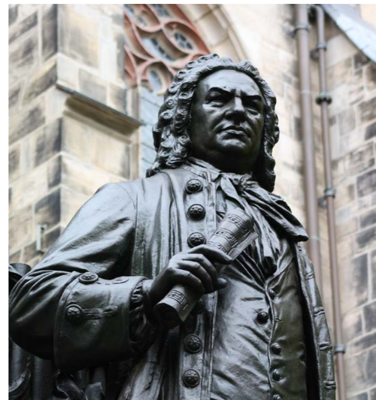
Johann Sebastian Bach

werden konnten. Es konnten eine Gefäßdilatation und eine Blutdrucksenkung unter klassischer Musik erreicht werden. Günstige Effekte wurden zum Beispiel unter der Musik von Bach und bei Kompositionen von Verdi beobachtet. Bei Beethovens 9. Symphonie konnten solche günstigen Effekte nicht gezeigt werden. Als Erklärung für diese Phänomene wurden unterschiedliche Wechsel der Tempi, der Lautstärken und der Dynamik bei Beethoven herangeführt, den ja gerade die Dynamik seiner Symphonie Nr. 5 c-Moll so bekannt gemacht hat. Es gibt ähnliche Studienergebnisse, welche aufzeigen, dass die Dynamik von Musikkompositionen bei verschiedenen Musikstilen eine signifikante Senkung des Blutdruckes und der Herzfrequenz hervorrufen.