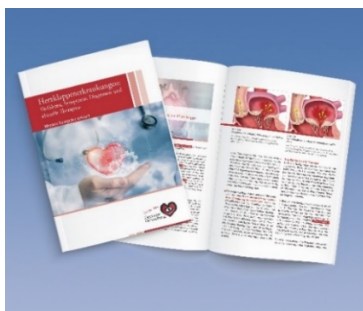
Der neue Herzstiftungs-Ratgeber Herzklappenerkrankungen: Verfahren, Symptome, Diagnosen und aktuelle Therapien“

www.herzstiftung.de/presse/bildmaterial/tavi-ablauf.jpg